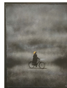
"Het meisje met het rode haar"

Na de herdenking drinken we graag samen met u een kopje koffie in de Vermaning tegenover het monument.